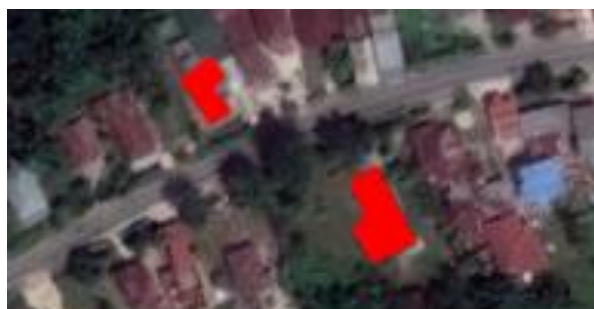
Gambar 1. Lokasi objek penelitian