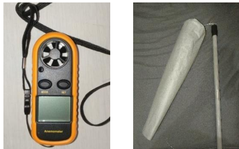
Gambar 2. Anemometer dan windsock DIY

Data indikator di atas diperoleh dengan memperhatikan beberapa hal, diantaranya: