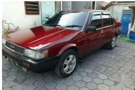
Gambar 1. Mobil Toyota Corolla

Toyota corolla SE saloon 1986 menggunakan mesin menggunakan tipe 2A dan mempunyai katup 16 klep dengan tenaga maksimum yang di hasilkan mencapai 72HP pada 6.200 rpm dengan torsi puncak mencapai 103 nm pada ketinggian 4.200 rpm, dengan menggunakan mesin berjenis karburator membuat spert Toyota corolla SE saloon ini murah dari pada yang lain.