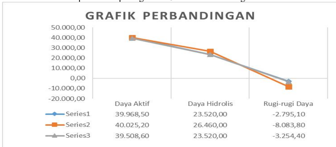
Gambar 3. Grafik Perbandingan Daya Aktif dan Daya Hidraulis Terhadap Rugi- Rugi daya

Grafik perbandingan daya aktif, daya hidrolis dari hasil penelitian performance test selama tiga hari pengukuran data lapangan dari tanggal 02 Januari sampai 05 Januari 2024, pada PDAM Tirta Mountala Aceh Besar dapat dilihat pada gambar 3 dibawah ini sebagai berikut: