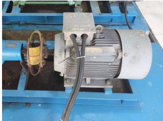
Gambar 1 Motor Listrik

Bahan Yang di gunakan pada penelitian ini seperti motor induksi tiga fasa dengan spesifikasi motor 20 Hp, 15 kW, 2 pole dan frekuensi 50 Hz pada kipas sentrifugal yang terhubung dengan sistem filterasi debu atau dust collector.