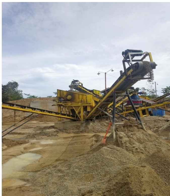
Gambar 3. Mesin stone crusher yang sedang dalam tahap perbaikan

Seperti halnya cuaca tidak ada yang tahu kapan turun hujan dan kapan cuaca tersebut cerah. Akan tetapi pada setiap proyek biasa mempunyai hasil prediksi cuaca. Dikarenakan perubahan cuaca ini material juga bisa datang terlambat ke lokasi pekerjaan sebab jalanan sangat licin. Seperti yang telah kita ketahui bahwa perjalanan untuk mengambil material sangatlah terjal dan harus melewati gunung-gunung. Jika keadaan hujan para pembawa material harus berjalan hati-hati. Sudah sering sekali terjadinya mobil angkutan material terbalik di jalanan gunung apalagi dengan muatan yang berat. Sedangkan yang terjadi di lapangan juga sangat lumayan mempengaruhi, seperti tidak bisa menghampar material atau aspal. Dan juga jalanan yang becek bisa membuat mobil pengangkut material tersangkut di lumpur dan akan membutuhkan waktu untuk menariknya.