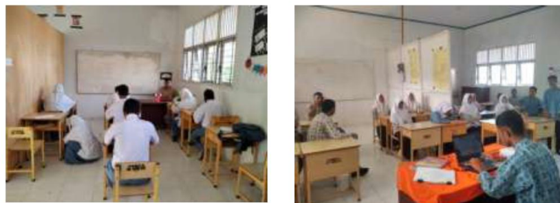
Gambar 1. Suasana ruang kelas dan aktivitas belajar di SLB Negeri Aneuk Nanggroe

Sekolah Luar Biasa (SLB) adalah sarana pendidikan bagi anak-anak berkebutuhan khusus, seperti Tunanetra, Tunarungu dan Tunagrahita mulai dari tingkat PAUD, TK, SD, SMP dan SMA. Keterbatasan ruang gerak dan sarana kelas (Gambar 1) pada SLB yang kurang memadai juga merupakan kendala dan permasalahan. Proses belajar mengajar juga digabung antara siswa-siswi SMP dan SMA yang memiliki karakteristik sama pada anak berkebutuhan khusus. Permasalahan lain adalah minimnya edukasi terkait bentuk dan warna, kurangnya media pembelajaran bentuk dan warna, belum optimalnya pengembangan kreativitas serta capaian/output produktivitas pada kegiatan ekstrakurikuler, keterampilan yang dihasilkan belum memiliki nilai ekonomis serta kurangnya kepercayaan diri pada siswa SLB dalam mengikuti event perlombaan baik pada tingkat SLB maupun sekolah umum. Hal tersebut yang menjadi fenomena dan isu permasalahan dalam pelaksanaan pengabdian kepada Masyarakat untuk dapat berpartisipasi dalam beredukasi terhadap bentuk dan warna pada siswa SLB Negeri Aneuk Nanggroe yang berlokasi di Desa Uteunkot, Kecamatan Muara Satu, Kota Lhokseumawe.