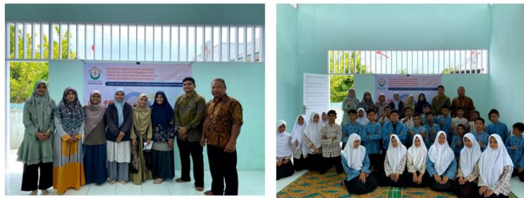
Gambar 10. Kegiatan ekspso pada edukasi bentuk dan warna pada kegiatan PkM hari kedua

Manfaat dan dampak yang diperoleh bagi mitra pengabdian khususnya siswa SLB Negeri Aneuk Nanggroe adalah siswa dapat berimprovisasi terhadap bentuk dan warna. Komunikasi yang terjalin selama proses pelaksanaan kegiatan tidak mengalami hambatan, karena selalu didampingi oleh guru penerjemah bahasa isyarat. Tak hanya itu, respon terhadap pelaksanaan kegiatan pengabdian ini adalah bagi Perguruan Tinggi terjalannya Memorandum of Agreement (MoA) dan Implementation Arrangement (IA) dengan mitra Sekolah yaitu SLB Negeri Aneuk Nnaggroe. Dampak juga sangat berpengaruh bagi tim pelaksana sebagai pelaksanaan kegiatan Tri Dharma Perguruan Tinggi, yaitu Pengabdian kepada Masyarakat. Di samping itu, mampu melaksanakan terapan sederhana melalui desain arsitektur bagi siswa SLBN Aneuk Nanggroe dalam meningkatkan IbM serta kreativitas/keahlian anak berkebutuhan khusus. Kerja sama yang baik antara mitra peagabdian dan tim pelaksana mengundang harapan besar oleh pihak mitra pengabdian, agar kedepannya akan terbentuk lagi edukasi-edukasi lain bagi siswa SLB Negeri Aneuk Nanggroe.