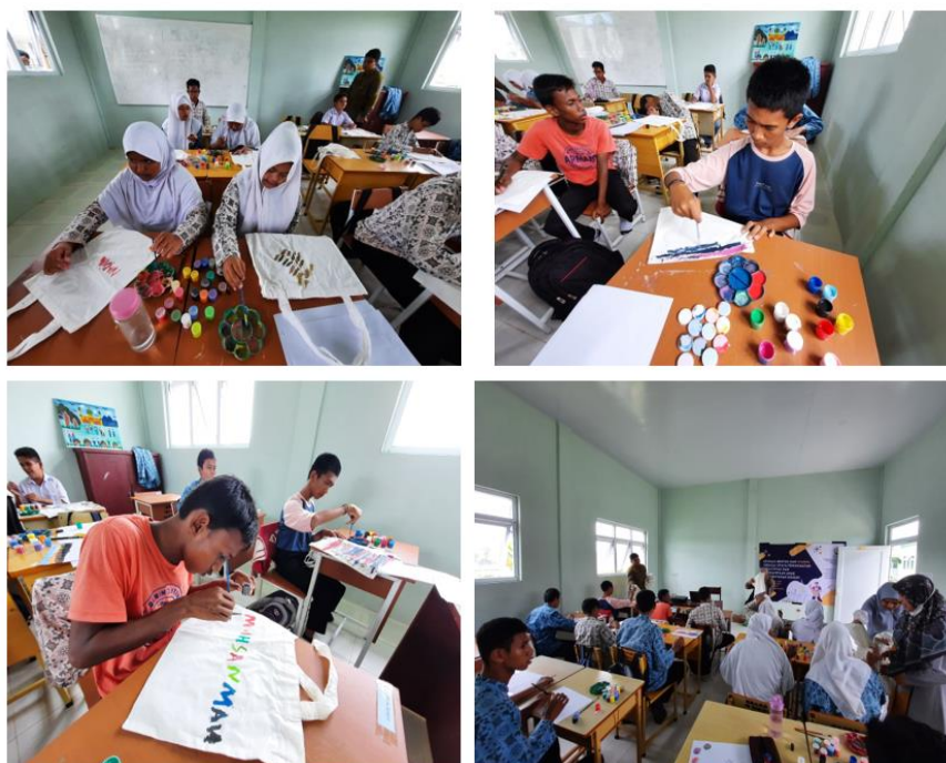
Gambar 6. Kegiatan pada ruang edukasi warna

Adapun pelaksanaan kegiatan dibagi atas dua ruang panel dan edukasi yang berbeda, akan dilaksanakan dalam waktu bersamaan. Ruang edukasi yang dimaksud adalah Ruang edukasi bentuk dikhususkan pada siswa tunarungu dengan capaian IbM yang diharapkan antara lain: siswa mampu mengenal dan membuat bentuk, mengenal dimensi bentuk, menciptakan bentuk-bentuk sederhana, serta mampu menggabungkan atau merangkai bentuk dalam satu kesatuan.