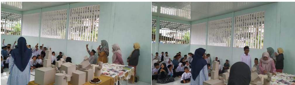
Gambar 8. Sesi edukasi (pemaparan materi) bentuk dan warna oleh tim pelaksana pengabdian kepada siswa SLB Negeri Aneuk Nanggroe