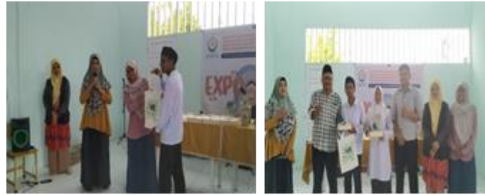
Gambar 13. Siswa-siswi yang mendapatkan penghargaan atas karya terbaik berdasarkan hasil workshop bentuk dan warna

Pelaksanaan kegiatan ini juga memberikan evaluasi yang baik bagi tim pelaksana dalam penerapan ilmu arsitektur agar dapat semakin dikenal dan dikembangkan dalam desain dan alat bantu edukasi sarana pembelajaran siswa SLB Negeri Aneuk Nanggroe. Adapun capaian instrumen dari kegiatan pengabdian kepada Masyarakat di SLB Negeri Aneuk Nanggroe yang diselenggarakan pada tanggal 21-22 September 2023 terdiri atas: