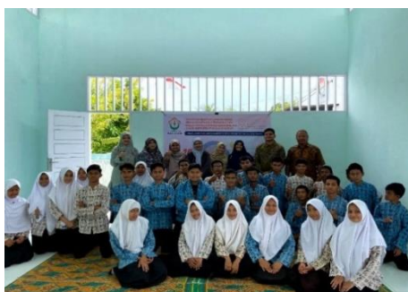
Gambar 5. Tim pelaksana pengabdian dengan guru dan siswa SLB Negeri Aneuk Nanggroe

Adapun pelaksanaan kegiatan dibagi atas dua ruang panel dan edukasi yang berbeda, akan dilaksanakan dalam waktu bersamaan. Ruang edukasi yang dimaksud adalah Ruang edukasi bentuk dikhususkan pada siswa tunarungu dengan capaian IbM yang diharapkan antara lain: siswa mampu mengenal dan membuat bentuk, mengenal dimensi bentuk, menciptakan bentuk-bentuk sederhana, serta mampu menggabungkan atau merangkai bentuk dalam satu kesatuan.