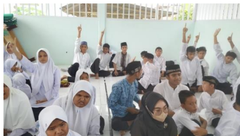
Gambar 9. Siswa SLB Negeri Aneuk Nanggroe sangat antusias terhadap materi yang disampaikan oleh tim pelaksana pengabdian

Media yang digunakan dalam kegiatan edukasi baik bentuk dan warna sangat berbeda. Adapun media yang digunakan untuk kegiatan edukasi bentuk antara lain: karton duplek, cutter, rol besi, gunting, lem fox, lem tembak, pensil, rautan pensil, dan penghapus. Media yang digunakan untuk ruang edukasi warna yaitu: pewarna akrilik, kuas, tempat