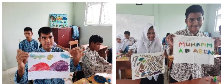
Gambar 11. Kegiatan ekspso hasil workshop terhadap warna