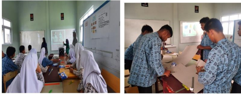
Gambar 7. Kegiatan pada ruang edukasi bentuk

tunagrahita dan autis. Pelaksanaan kegiatan dibagi menjadi 3 (tiga) sesi, yaitu: edukasi (pemaparan materi), workshop, dan pameran hasil karya siswa saat workshop.