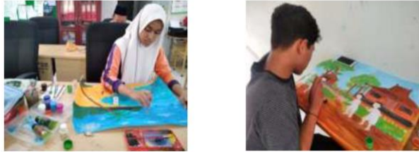
Gambar 2. Siswa SLB Negeri Aneuk Nanggroe sedang melaksanakan kegiatan ekstrakurikuler

bentuk dan warna secara visual, serta ketepatan skala dan proporsi dari bentuk mampu meningkatkan inspirasi, kenyamanan dan kesenangan, baik secara fisik maupun psikis, sehingga memberi ekspresi ide atau gagasan dalam bereksplorasi dan berkreasi secara bebas tanpa menghambat perkembangan kreativitasnya. Pemenuhan nilai estetika bentuk dan warna yang dapat menjadi stimulus kreativitas anak, dicapai melalui keterpaduan ( unity ), keseimbangan ( balance ), proporsi, skala, dan irama.