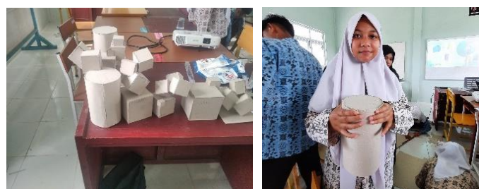
Gambar 12. Kegiatan ekspso hasil workshop terhadap bentuk