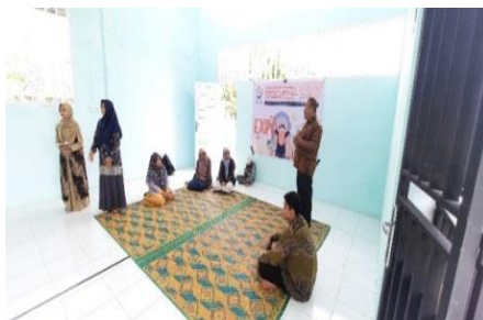
Gambar 4. Kepala Sekolah SLB Negeri Aneuk Nanggroe memberikan kata Sambutan