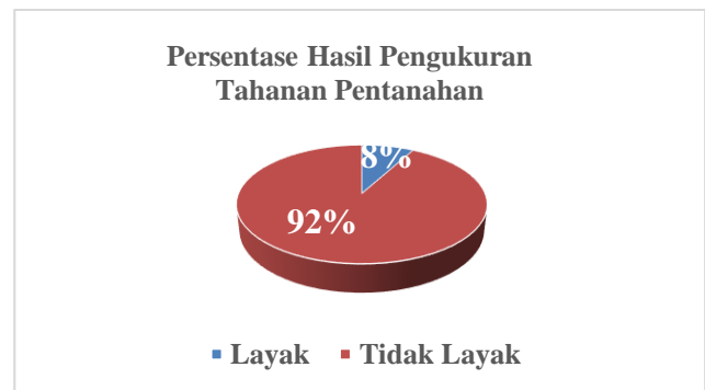
Gambar 1. Grafik persentase hasil pengukuran tahanan pentanahan

Jadi, hasil perhitungan persentase kelayakan tahanan pentanahan pada 25 rumah tinggal di Gampong Mesjid Tanjong Kecamatan Padang Tiji Kabupaten Pidie dapat digambarkan seperti grafik dibawah ini.