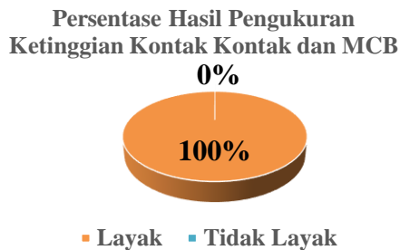
Gambar 3. Grafik persentase hasil kelayakan terhadap ketinggian kotak kontak dan kotak MCB

Dari Tabel 3 dan Gambar 3 menunjukkan bahwa hasil pengukuran ketinggian kotak kontak dan kotak MCB pada instalasi listrik rumah tinggal di Gampong Mesjid Tanjong Kecamatan Padang Tiji Kabupaten Pidie didapatkan semua rumah tangga sudah memenuhi standar PUIL (100%) dimana untuk pemasangan kotak kontak diukur dari lantai lebih dari sama dengan 1,25 meter, dan untuk pemasangan pengaman lebih dari sama dengan 2,0 meter.