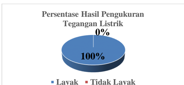
Gambar 2 Grafik persentase hasil kelayakan tegangan listrik

Jadi, hasil perhitungan persentase kelayakan tegangan listrik pada 25 rumah tinggal di Gampong Mesjid Tanjong Kecamatan Padang Tiji Kabupaten Pidie dapat digambarkan seperti grafik dibawah ini.