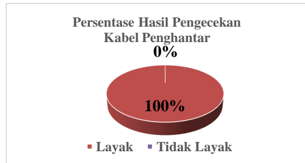
Gambar 4. Grafik persentase hasil kelayakan kabel penghantar listrik

Jadi, hasil perhitungan persentase kelayakan kabel penghantar listrik pada 25 rumah tinggal di Gampong Mesjid Tanjong Kecamatan Padang Tiji Kabupaten Pidie dapat digambarkan seperti grafik dibawah ini.