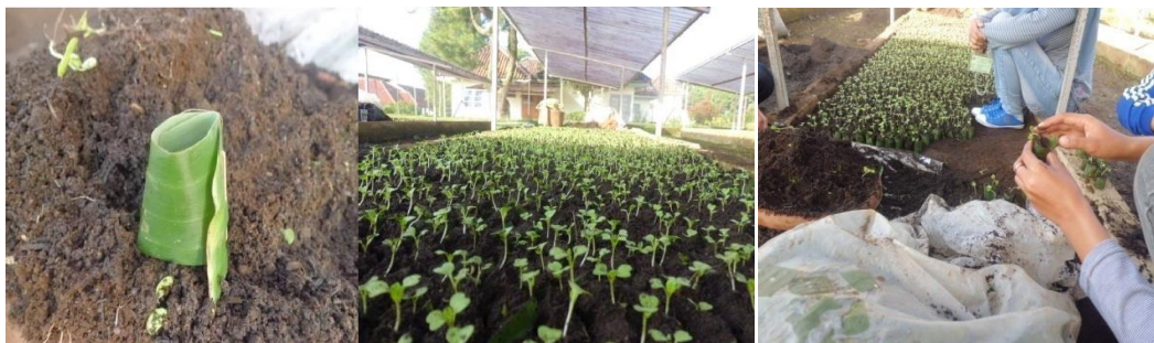
Gambar 2. Pembumbunan Selada Menggunakan Daun Pisang

Pemindahan tanaman ke bumbunan adalah tahap dimana bibit yang telah berumur 10 hari setelah penebaran biji siap untuk dipindahkan kedalam bumbunan atau media steril yang di bungkus dengan daun pisang yang menyerupai silinder berdiameter 3 cm dan tinggi 3 cm.