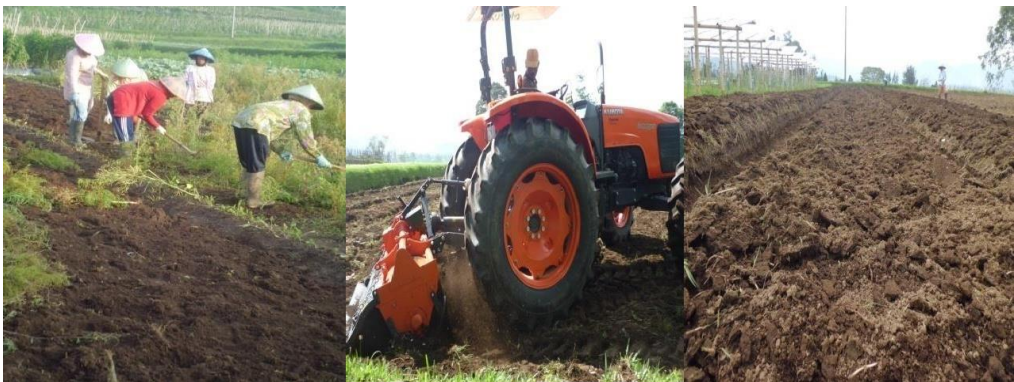
Gambar 3. Kegiatan Pengolahan Lahan

Bersamaan dengan kegiatan pembibitan di persemaian lahan untuk kebun selada segera di olah. Pengolahan tanah sebaiknya dilakukan antara 7-14 hari sebelum tanam agar keadaan tanahnya sempurna untuk mendukung pertumbuhan tanaman selada yang optimal.