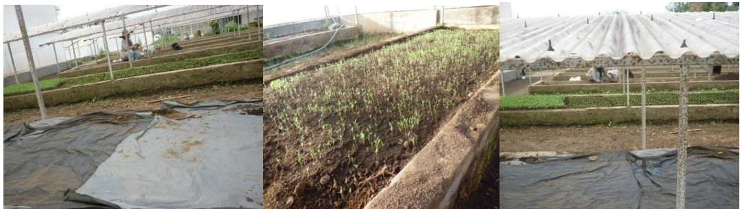
Gambar 1. Tempat Persemaian Selada di Balitsa

Sebelum ketahap persemaian benih dilakukan terlebih dahulu penyiapan lahan persemaian dan media persemaian yang baik untuk perkecambahan selada. Di BALITSA lembang, tempat persemaian dibuat berbentuk bak dari semen dengan ukuran lebar 1 m dan panjang kurang lebih 10 m dengan kedalaman 30 cm. atapnya dibuat miring ke sebelah timur dengan ketinggian tiang 1 m dan 85 cm di sebelah barat.