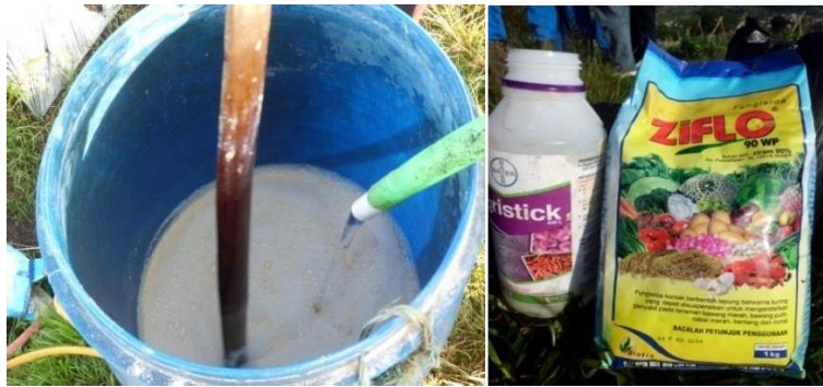
Gambar 4. Pemberian Pupuk Susulan