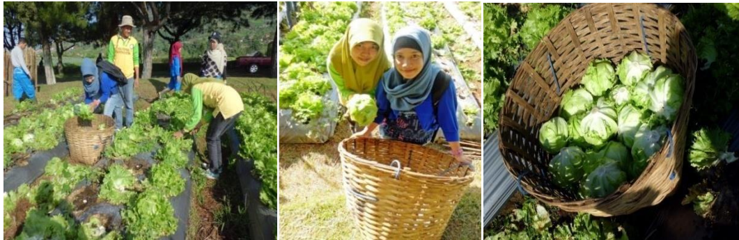
Gambar 5. Pemanenan Selada

Pemanenan dilakukan jangan sampai terlambat karena akan menyebabkan kropnya pecah (retak-retak) dan kadang akan diikuti oleh pembusukan. Apabila tanaman selada melewati masa panen maka akan mengalami bolting yaitu perubahan dari fase vegetatif menjadi fase generatif, selada yang mengalami bolting tidak mempunyai nilai jual.